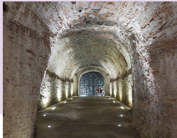
passages sous les remparts de Lucques

Les murs qui s'admirent aujourd'hui ont une longueur de 4 km et 233 m de long et sont de 12 m de haut avec une largeur à la base de 30 m.